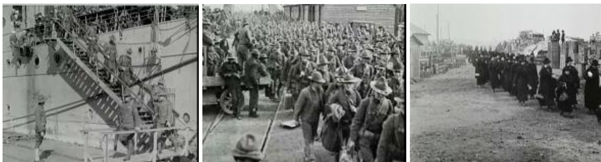
Photogrammes extraits du film Armée américaine en France : camps, front en Meurthe-et-Moselle Noir et blanc, muet, durée : 16 min. 45 sec. Réf. 14.18 A 1160.

En 1918, dans le port de Saint-Nazaire, les troupes américaines débarquent sur les quais. Les hommes, équipés de leur fusil et d'un chapeau, descendent des navires arrimés aux quais. Les soldats débarquent de péniches et prennent la route de la gare ferroviaire sous le regard de soldats noirs américains employés au déchargement des navires. Dans la gare ferroviaire, un train part, chargé de soldats. Les hommes saluent la caméra par les fenêtres. Des marins américains posent en compagnie d'enfants de la ville. Les hommes tiennent les filles et les garçons sur leurs genoux et leur offrent des cadeaux. Des veuves marchent en colonne dans le port de Saint-Nazaire.