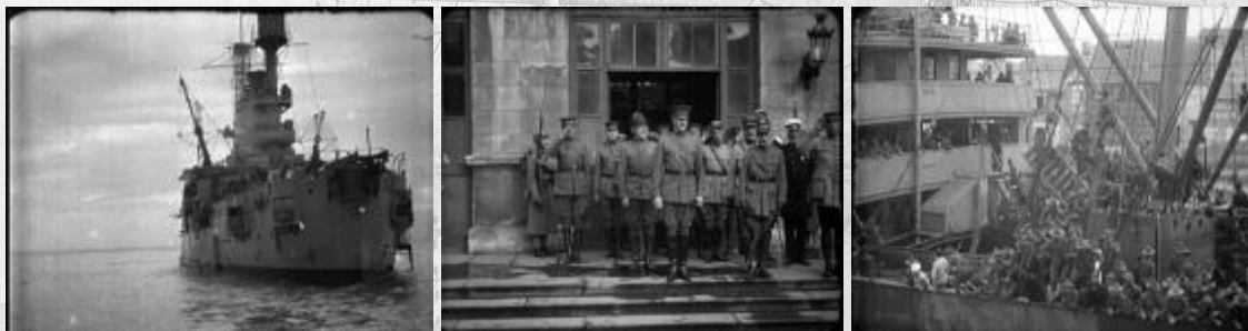
Photogrammes extraits du film Débarquement de troupes américaines à Saint-Nazaire Noir et blanc, muet, durée : 12 min. 59 sec. Réf. 14.18 A 1139.

En 1918, dans le port de Saint-Nazaire, les troupes américaines débarquent sur les quais. Les hommes, équipés de leur fusil et d'un chapeau, descendent des navires arrimés aux quais. Les soldats débarquent de péniches et prennent la route de la gare ferroviaire sous le regard de soldats noirs américains employés au déchargement des navires. Dans la gare ferroviaire, un train part, chargé de soldats. Les hommes saluent la caméra par les fenêtres. Des marins américains posent en compagnie d'enfants de la ville. Les hommes tiennent les filles et les garçons sur leurs genoux et leur offrent des cadeaux. Des veuves marchent en colonne dans le port de Saint-Nazaire.