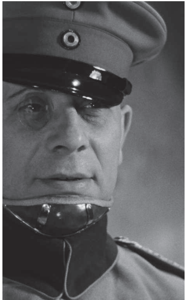
Erich von Stroheim

La campagne de promotion, lancée par la presse spécialisée en avril 1937, atteint la presse quotidienne et bénéficie de la récente ouverture de l'Exposition Internationale de Paris. Le film est présenté pour la première fois à l'occasion d'une soirée privée au cinéma Le Marivaux le 8 juin 1937.