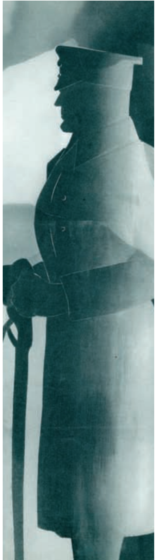
Pressbook 1937, collections La Cinémathèque de Toulouse.

Toutes ces initiatives convergent progressivement avec les préoccupations de la puissance publique qui change de point de vue sur le cinéma à partir du milieu des années 1930. Pourtant, la puissance publique se limitera à son rôle de censeur jusqu'au régime de Vichy et à l'Après-Guerre.