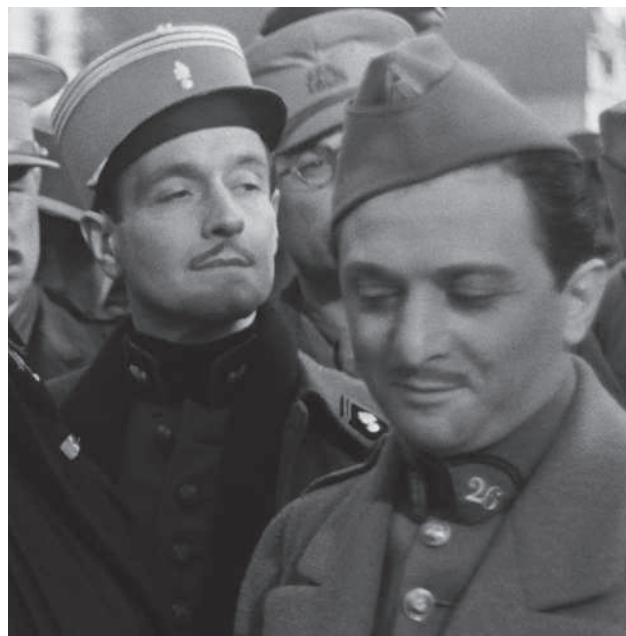
Pierre Fresnay - Marcel Dalio

Maréchal et Rosenthal ont réussi à échapper aux poursuites. Péniblement, ils avancent vers la frontière. Rosenthal, s'étant foulé la cheville, ralentit leur marche et les oblige à se réfugier dans une grange où une Allemande, Elsa, les découvre. Elle leur propose de les héberger. Son mari et ses frères sont morts à la guerre et elle vit seule avec sa fille. Maréchal s'éprend d'Elsa. Mais une fois Rosenthal guéri de son entorse, les deux hommes doivent penser à regagner la Suisse, et partent. Il atteignent la frontière. Maréchal dit à Rosenthal son désir de voir la guerre finir au plus vite, pour pouvoir retrouver Elsa. Ils évitent de peu une patrouille allemande. Le dernier plan du film les montre, points noirs mobiles avançant péniblement sur la neige qui recouvre aussi bien l'Allemagne que la Suisse.