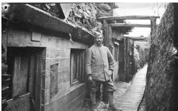
"Les abris au PL du centre Vasnier", 5NUM/29/77, novembre 1916

Le Calvados se distingue aussi par le nombre de ses réfugiés en provenance de Belgique et du Nord de la France : au total près de 26 000 réfugiés français et 13 000 réfugiés belges s'installent dans le Calvados pendant les 4 années de ce conflit.